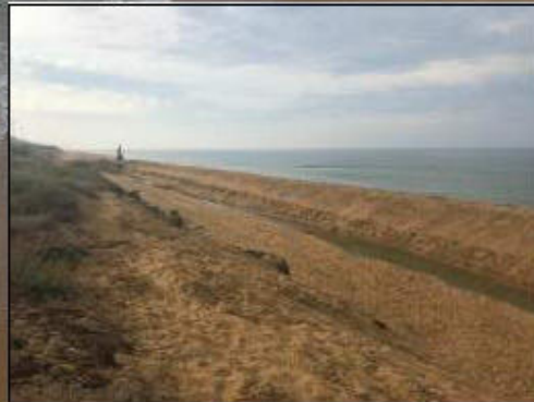
EJECUCIÓN DE LAS OBRAS